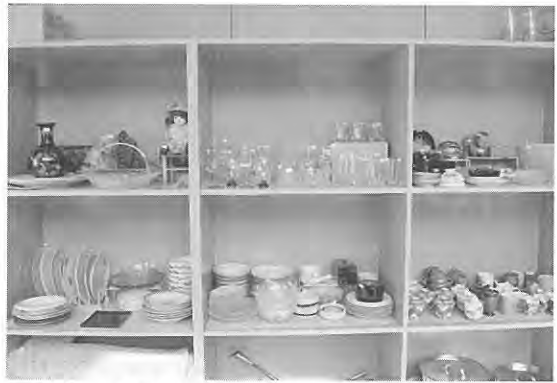
ぬくもりの湯の一部を借りて、常設のフリーマーケットコーナーも設置しています

20年以上前においわけメロンまつりにフリーマーケットを出店したのをきっかけに、賛同する仲間が集まり、連絡会を結成し、現在は、23名の会員が登録しています。追分の労働会館や町内のイベント等で、年5回程フリーマーケットを開催する他、町外のイベントにも出店し、会員が持ち寄った不用品や手作りの小物などを販売しています。