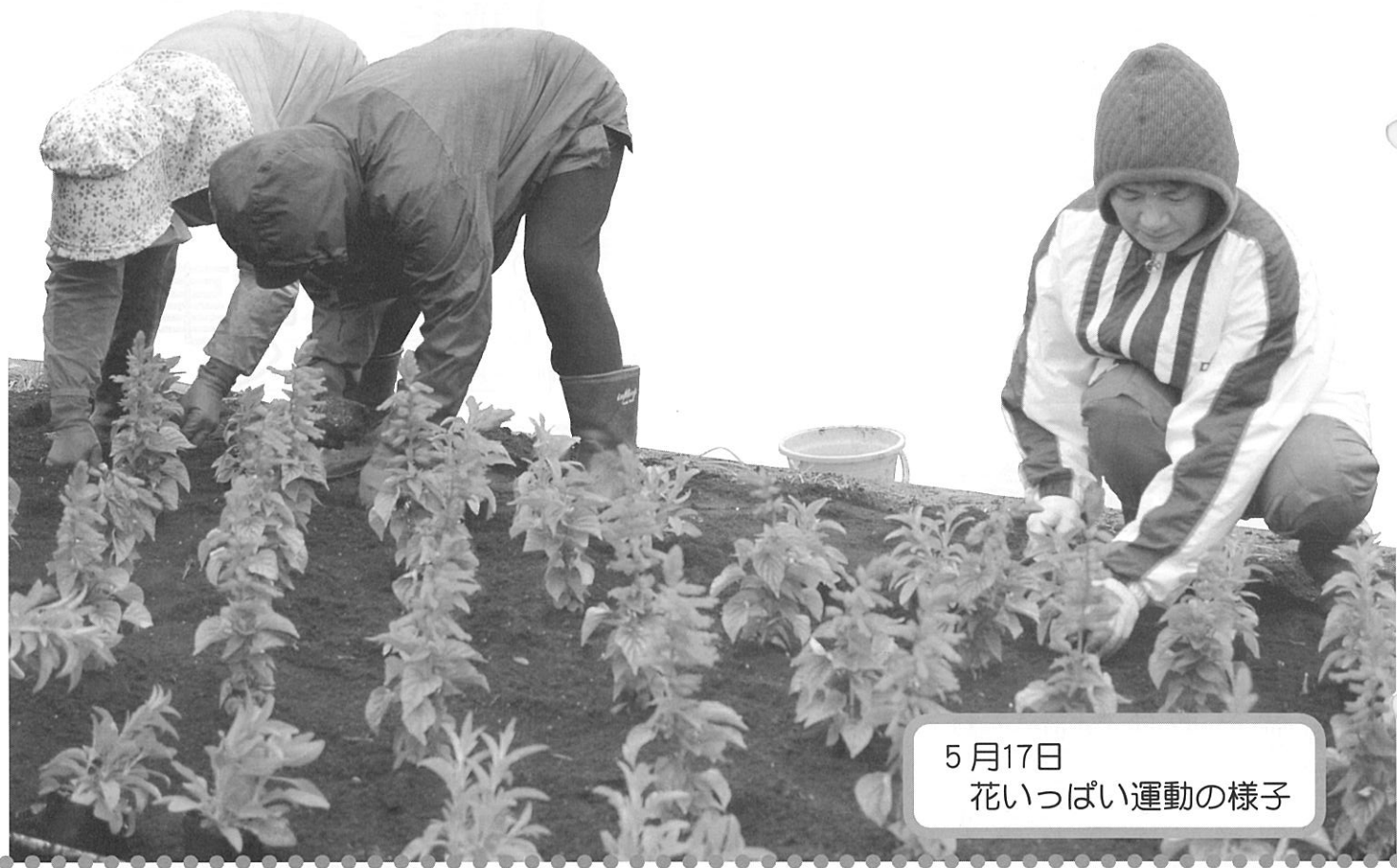
5月17日 花いっぱい運動の様子