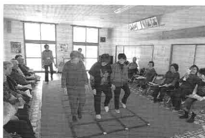
北進自治会でのふまねっと運動の様子

地域活動に使用する車両も貸出しています。利用料は無料ですが、使用した燃料については補充していただきます。