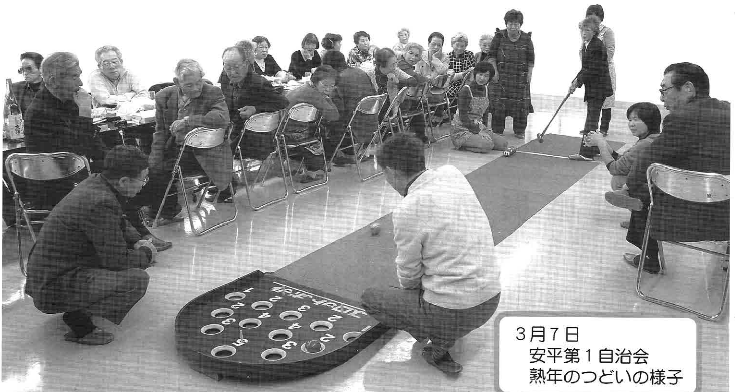
3月7日 安平第1自治会 熟年のつどいの様子