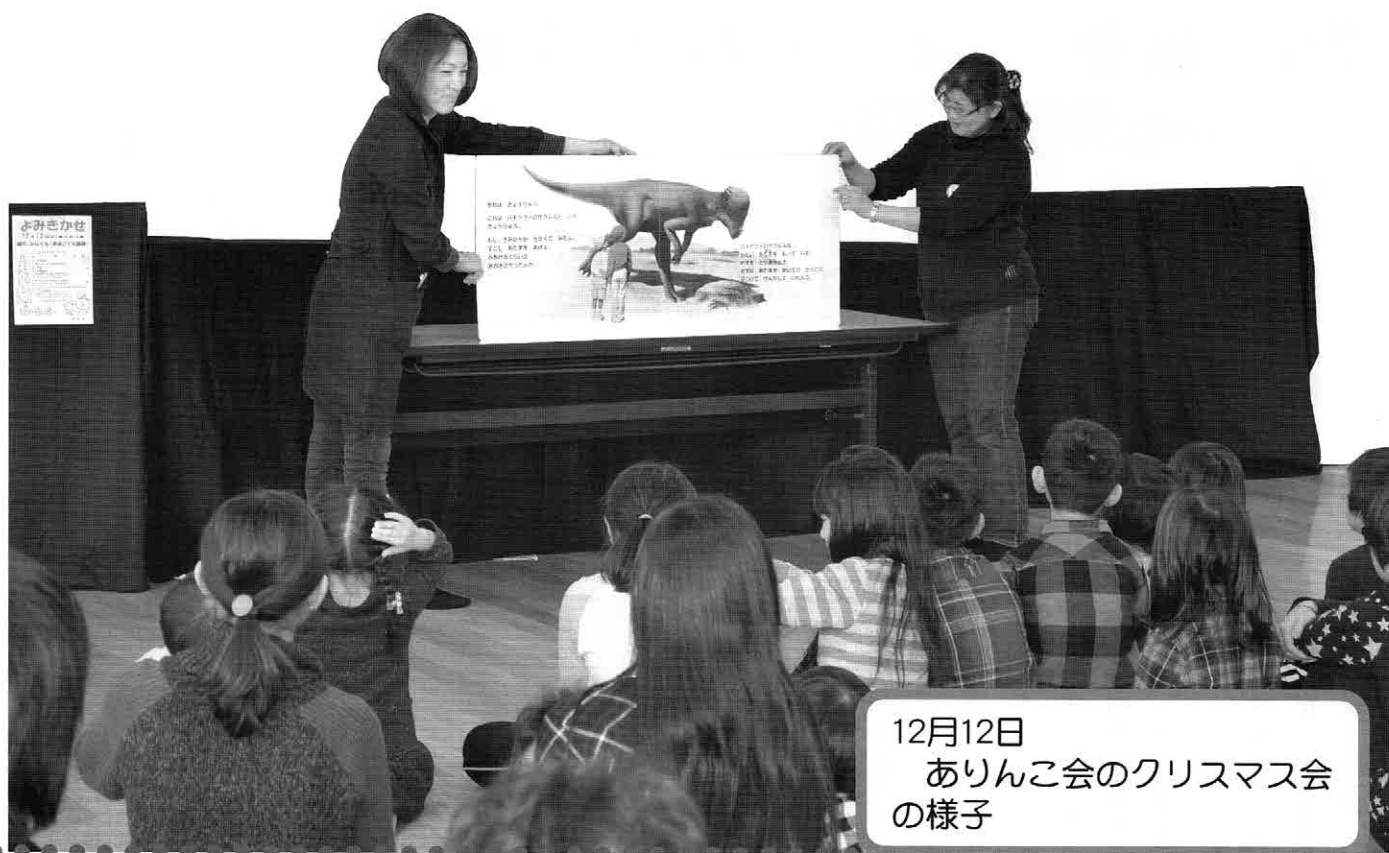
12月12日 ありんこ会のクリスマス会 の様子