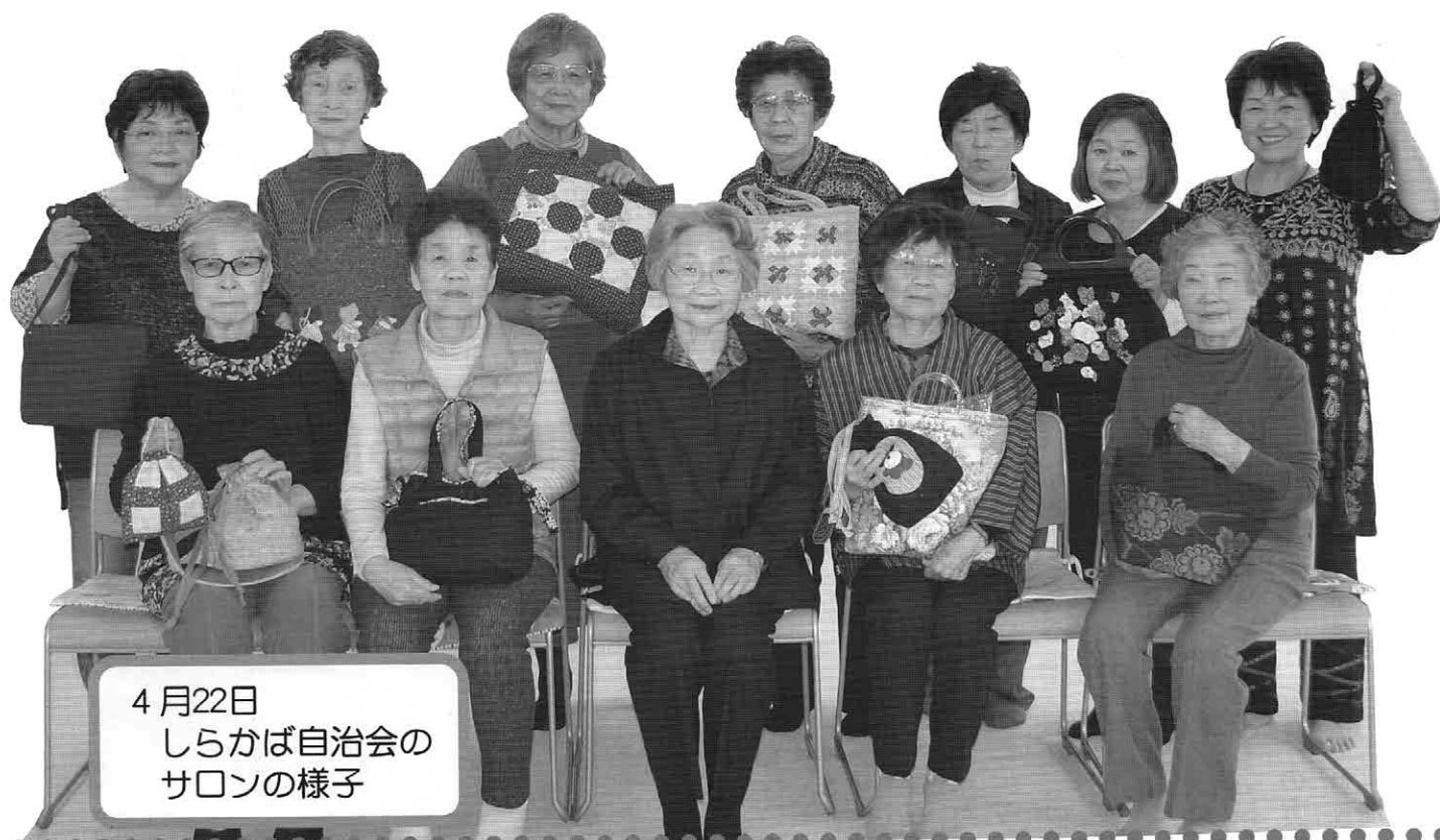
4月22日 しらかば自治会の サロンの様子