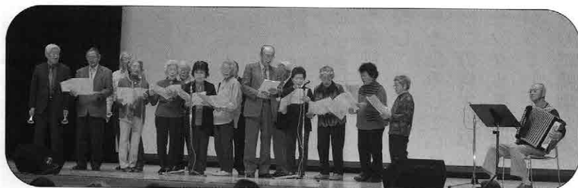
10月16日 高齢者芸能発表会の様子