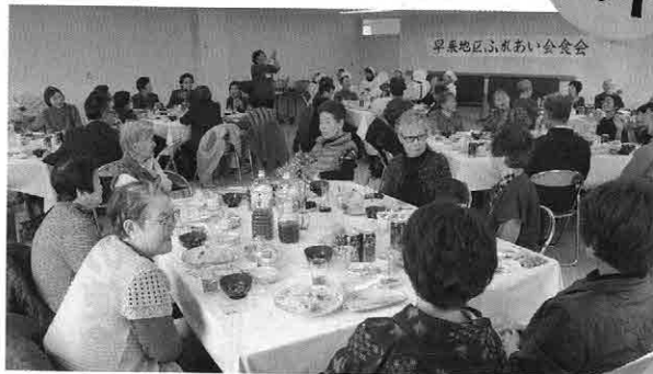
写真は、早来地区ふれあい会食会の様子

早来地区と安平地区でそれぞれ、ひとり暮らしの高齢者を対象にしたふれあい会食会が行われ、早来地区は給食ボランティアの皆さんが、安平地区は安平婦人会の皆さんが、手作りの料理でもてなしました。 早来地区では、デイサービスセンターサックルの職員の皆さんが、クイズや歌を交えたレクリエーションで笑顔を誘い、参加者は、楽しいひと時を過ごしていました。