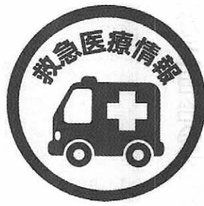
玄関用ステッカー 1枚