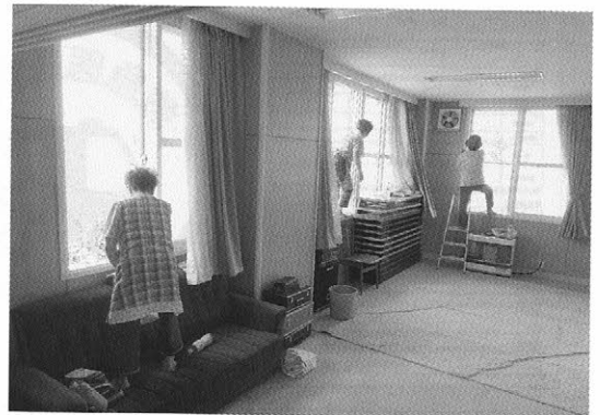
地域の皆さんによる会館清掃の様子

会館清掃からたくさんの住民の皆さんに協力をいただき、第1回目は7月13日に行われ、和気あいあいと時間が足りなくなるまで、楽しく過ごされていました。