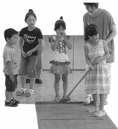
7月9日 追分第4町内会のふれあい サロンの様子