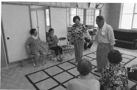
さかえ自治会でのふまねっと運動の様子

あまり負担にならない、長く続けられる活動を目指しており、立ち上げの支援や活動内容等の相談にも応じますので、活動を検討される団体の方は、お気軽に社協までご相談ください。