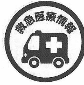
冷蔵庫用マグネット 1枚