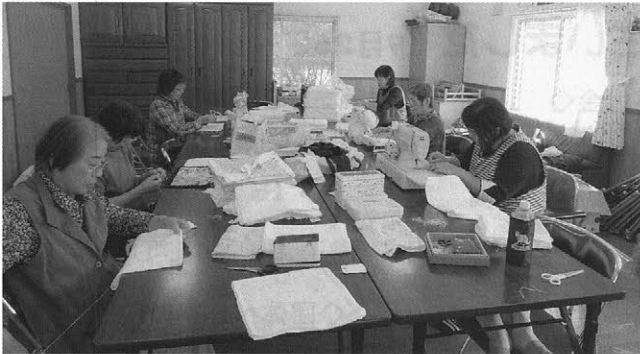
富門華寮での繕い物ボランティアの様子

早来婦人会は、早来地区に在住の女性により組織された団体で、女性の視点から地域の課題について研修を深め、様々なボランティア活動に取り組んでいる団体です。 活動の幅は広く、地域でのイベントの支援や花壇整備、駅舎清掃、交通安全活動、社会福祉施設でのボランティア活動など、様々な分野で地域の活性化に大きな役割を果たしています。