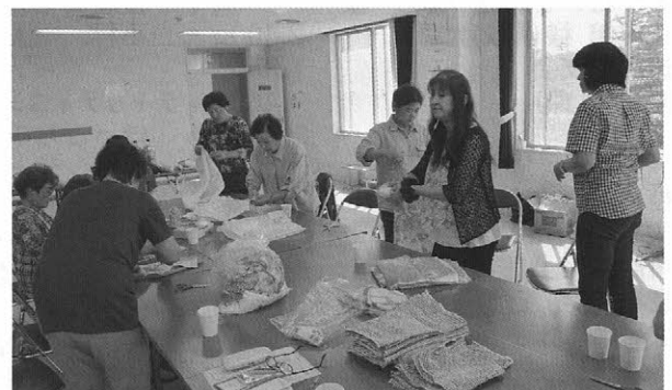
福祉施設寄贈用タオル作製の様子

早来婦人会は、早来地区に在住の女性により組織された団体で、女性の視点から地域の課題について研修を深め、様々なボランティア活動に取り組んでいる団体です。 活動の幅は広く、地域でのイベントの支援や花壇整備、駅舎清掃、交通安全活動、社会福祉施設でのボランティア活動など、様々な分野で地域の活性化に大きな役割を果たしています。