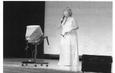
10月19日 高齢者芸能発表会の様子