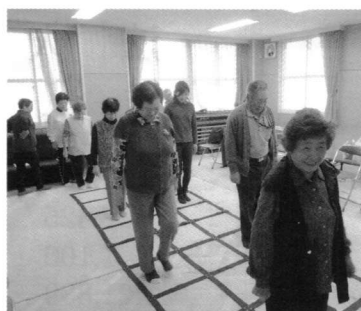
さかえ自治会のふまねっと運動の様子