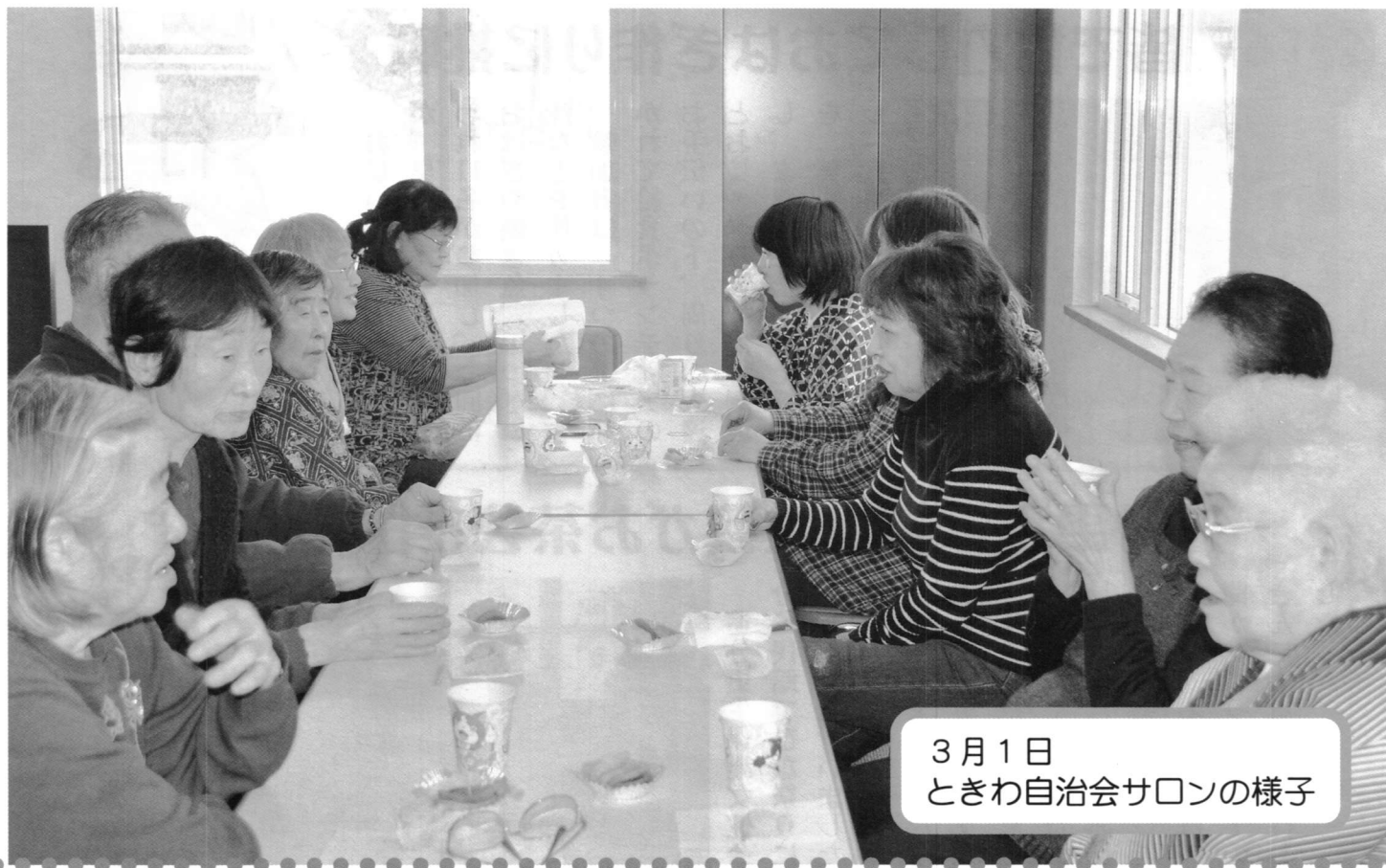
3月1日 ときわ自治会サロンの様子