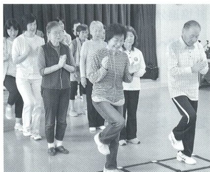
安平ふまねっと運動の様子