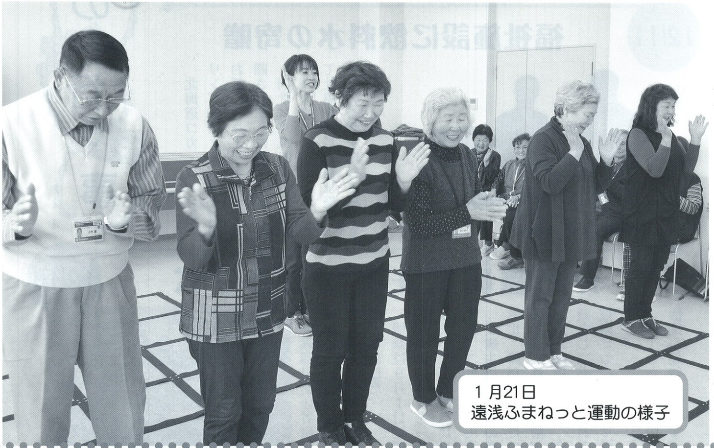
1月21日 遠浅ふまねっと運動の様子