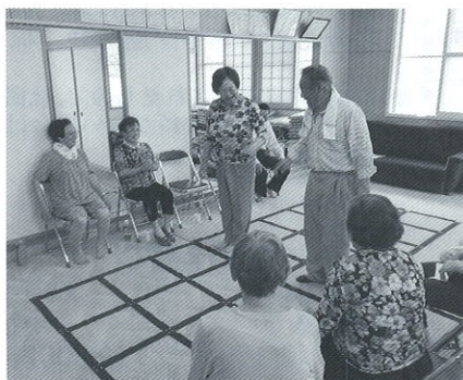
栄町ふまねっと運動の様子