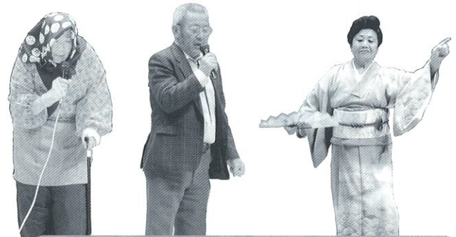
3月26日 高齢者みんなで頑張ろう大会の様子